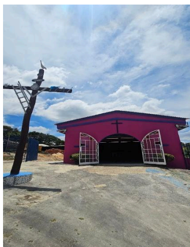
Capela Nossa Senhora do Rosário Data: 28/10/2025

O projeto tem como objetivo realizar obras de requalificação arquitetônica das edificações conhecidas como Casa Paterna e Capela de Nossa Senhora do Rosário, localizadas na Comunidade Quilombola dos Arturos para tratamento das patologias existentes em suas estruturas e infraestruturas.